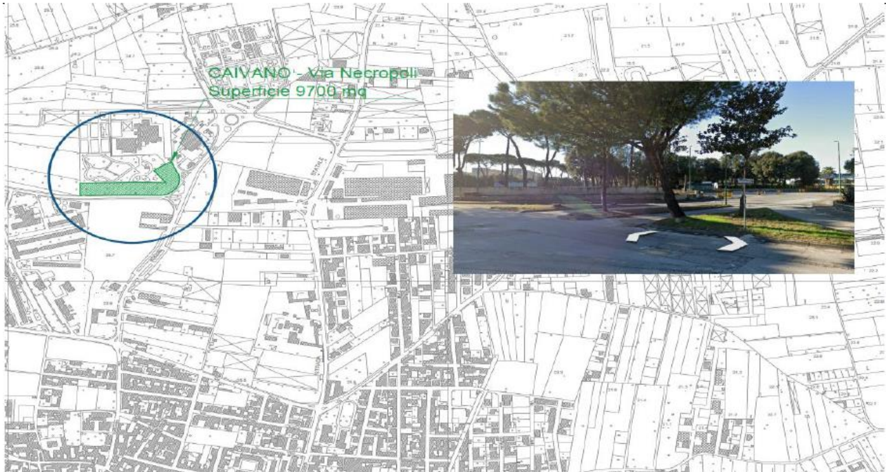
Figura 1. Collocazione territoriale area di intervento

Si riportano di seguito alcune foto aeree per l'individuazione dell'area oggetto dell'intervento.